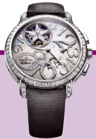
Zenith, Star Tourbillon El Primero: Précision et étoile de diamants.