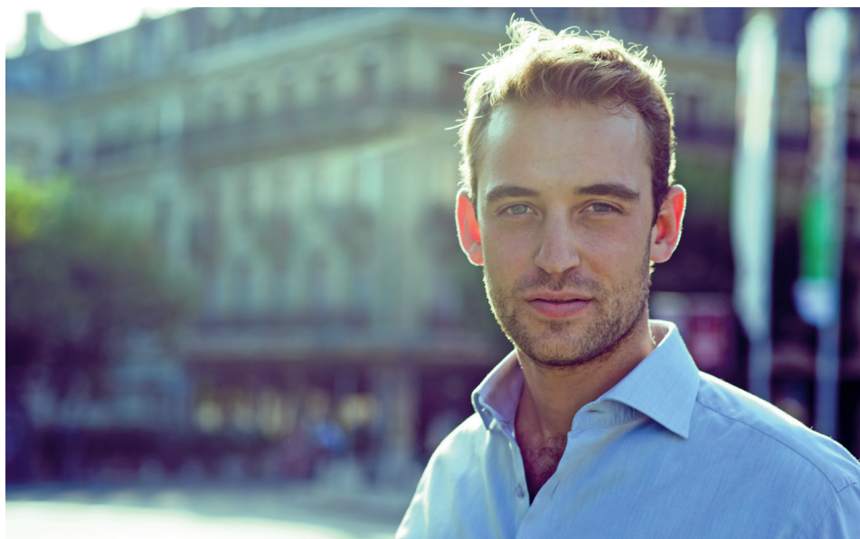
> L'écrivain Joël Dicker.