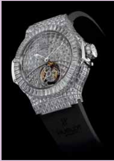
Hublot, One million $ Big Bang: plus de 2000 heures de travail pour celle qui vient de recevoir le grand prix d'horlogerie de Genève 2007.