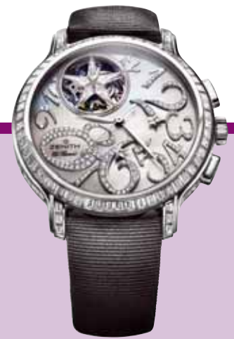
Zenith, Star Tourbillon El Primero: Précision et étoile de diamants.