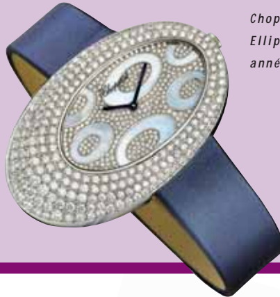
Chopard, Montre Ellipse: clin d'œil aux années 60 et 70.