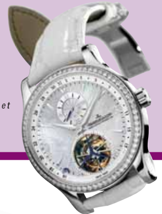
Jaeger-LeCoultre, Master Tourbillon: cadran en nacre, impressions blanches et précieuses de l'hiver.