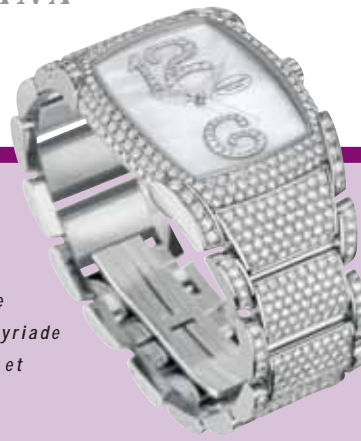
Parmigiani, Kalpa grande joaillerie: myriade de diamants et cambrures.