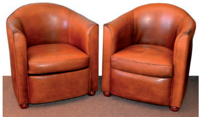
▼ Des fauteuils-club du Saint-James à Paris, signés Andrée Putman, qui accueillirent l'émission TV de Bernard Rapp «L'assiette anglaise».