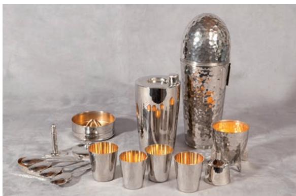
▼ Shaker Zeppelin des années 40 qui contient tout le nécessaire pour déguster un cocktail en rase campagne.