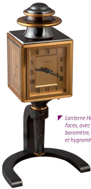
▼ Lanterne Hermès à quatre faces, avec boussole, baromètre, thermomètre et hygromètre.