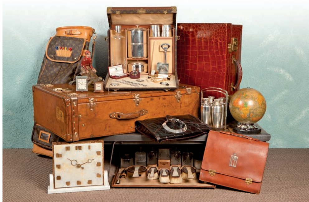
▼ Des bijoux, des pendules, des malles Vuitton de toutes tailles, des clubs anglais, des luminaires art déco, des nécessaires de toilette, des plaids, des maroquins ou des caves à whisky de voyage, signées Christofle en métal argenté...