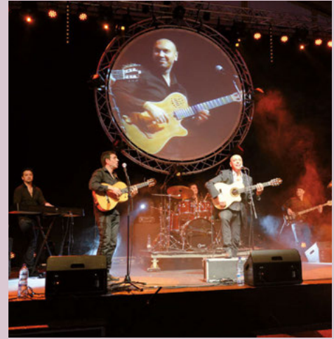
Les Gipsy Kings ont animé la soirée.