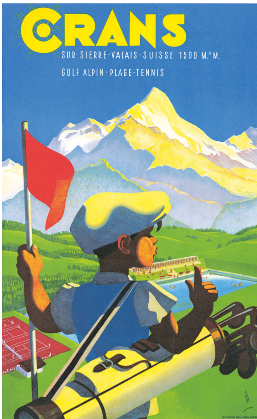
> Crans-sur-Sierre, affiche, 1943.