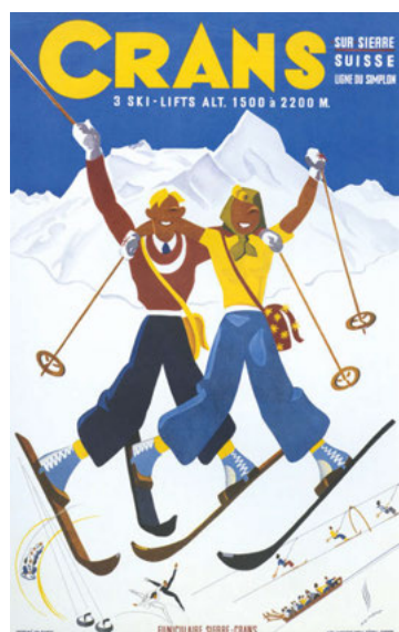
> Crans-sur-Sierre, affiche, 1941.