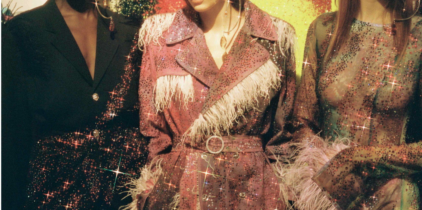
Détail de la nouvelle collection automne-hiver 2020/21 présentée en février dernier durant la Fashion Week de Paris chez Christie's.