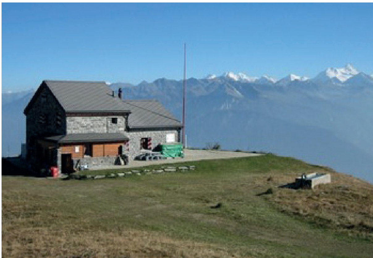
Dès 1944, deuxième cabane des Violettes.

This year, more than a total of 40 activities and outings will be offered to mark this anniversary, as well as a participatory project consisting of the ascent of 19 summits of the Haut-Plateau communes by groups of friends.