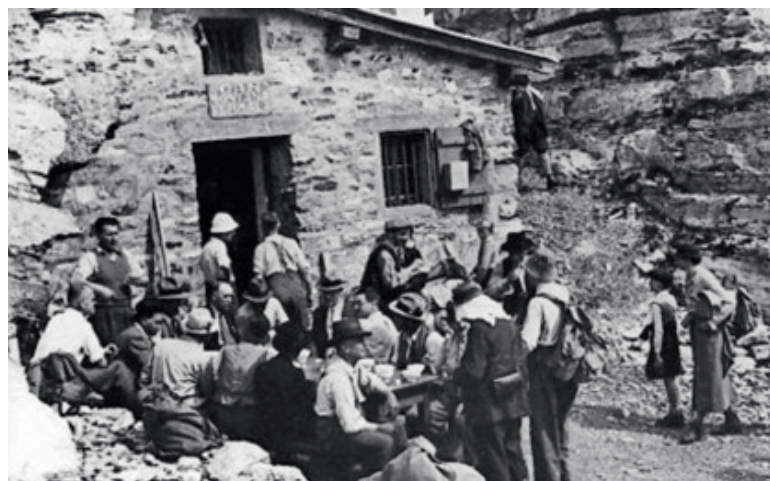
1 re Cabane des Violettes (1924). – ©Deprez, Crans-Montana