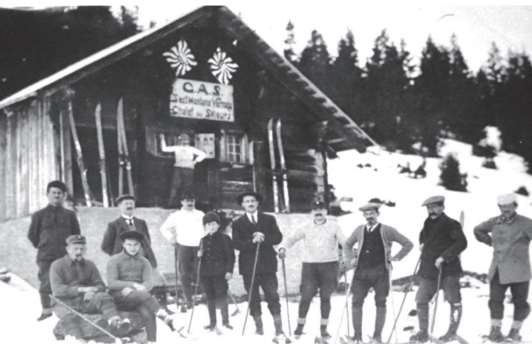
Le chalet des skieurs.