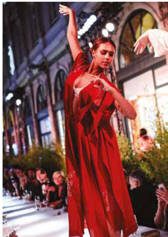
Spectacle pour le lancement d'une marque de vêtements en 2017 aux Galeries Royales Saint-Hubert à Bruxelles

When asked what she dreams of for the future, her reply comes as if it were evident. "To put on my own show in Crans-Montana. This project has been with me for a very long time."