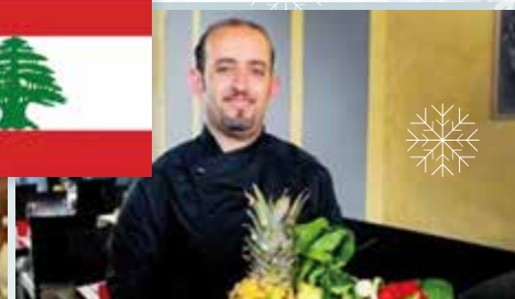
La Nuit des Neiges témoigne de l'amitié liant le Valais et la Suisse au Liban (Restaurant Le Valais-Chabrouh-Liban)