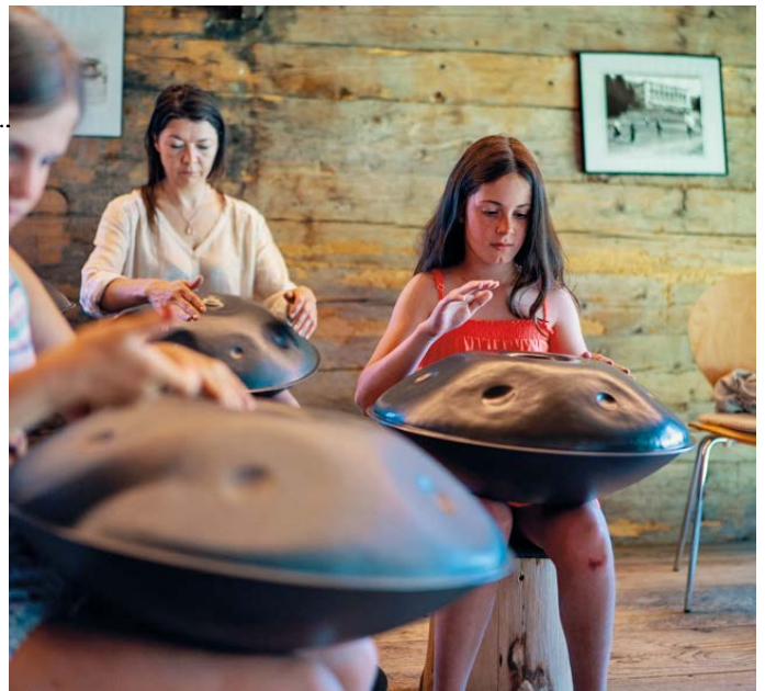
Hameau de Colombire